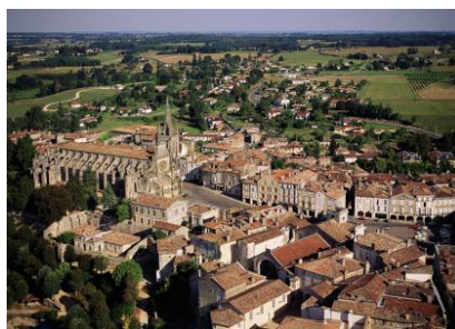
Bazas ( Cossio-Civitas Vasatium )