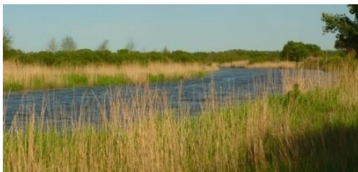
Le delta de l'Eyre, proche du site de Boios-Civitas Boiatium

faisait vraisemblablement pas partie à l'époque des Boiates de l'Antiquité. Lanton, Audenge, Marcheprime, Biganos, Mios, Salles (appelé aussi Salles-en-Buch. Il faut vraisemblablement renoncer à y voir la station de Salomacum), Lugos, Belin (mais pas Beliet). 40 Mano, Argelouse, Sore, Trensacq, Sabres, Solférino, Escource, Sindères (vraisemblablement Coaequosa sur la limite avec les Tarbelles), Onesse-et-Laharie, Lévigacq, Uza, Saint-Julien-en-Born.