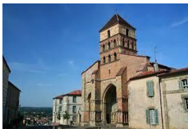
L'église Sainte Quitterie à Aire (Atura-Vicus Julii)