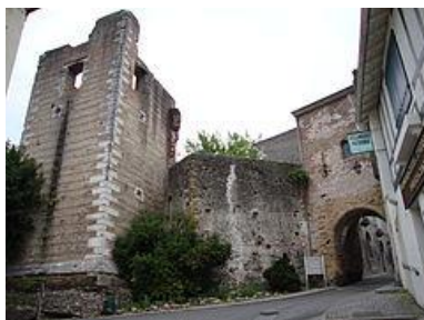
Lascar ( Lascurris-Bearnum )