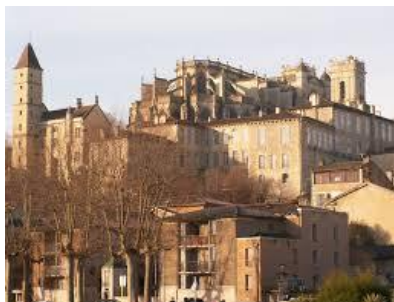
Auch (Elimberri-Civitas Auscorum)