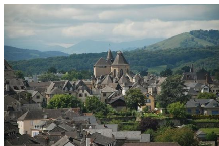
Oloron ( Iluro-Civitas Lurunensium )