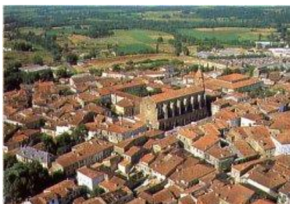
Eauze ( Elusa )