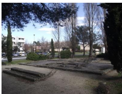
Tarbes, fondations d'une villa antique ( Turba )