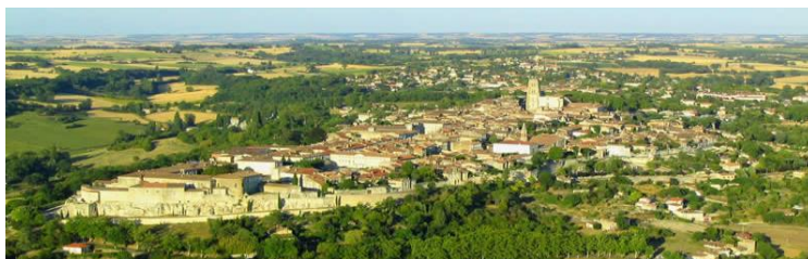
Lectoure ( Lactora )