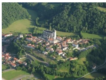
Saint-Bertrand-de-Comminges ( Lugdunum Convenarum )

y fut joint au cours du XIII ème siècle pour former un archiprêtré de Buch et Born. La complexité des divisions religieuses qu'on observait à cet endroit sous l'Ancien Régime est sans doute la conséquence de ce démembrement.