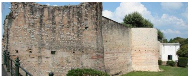
Remparts gallo-romains, Dax ( Aquae Tarbellicae )